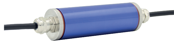
Analoger Kabelmessverstärker, Typ B1940