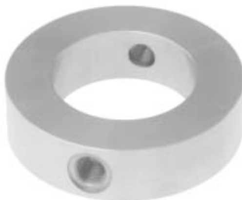
Проставка Модель 910.27